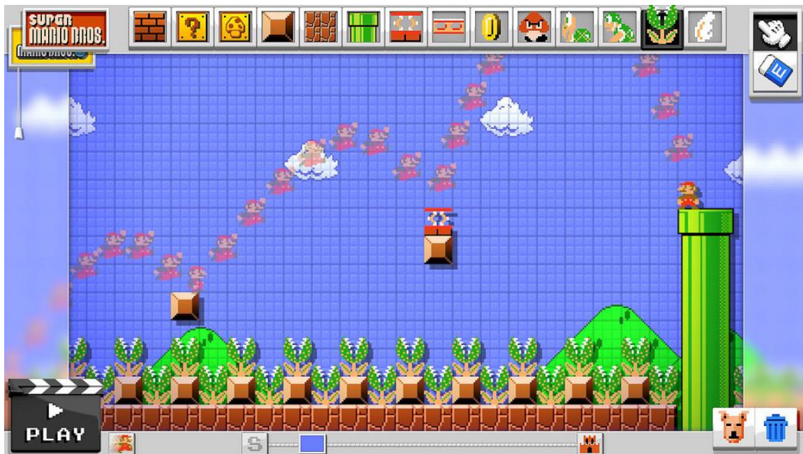
Le jeu Mario Maker vous met dans la peau d'un concepteur de niveau en toute simplicité.

Attention! Il y a un trou juste là! Et un ennemi juste après! Les niveaux sont créés par les « levels designer » ou concepteurs de niveaux. Ils veillent à donner un bon niveau de difficulté tout en procurant assez de plaisir pour que le joueur continue à jouer.