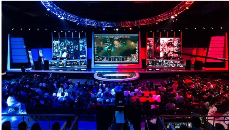
Voici à quoi ressemble une compétition de sport électronique (e-sport)

Il existe tout de même des « gamers professionnels » qui vivent de leurs passions en participant à des compétitions ou en diffusant du jeu vidéo. Ce qui est plus courant en Asie qu'en Amérique, mais qui gagne du terrain d'année en année.